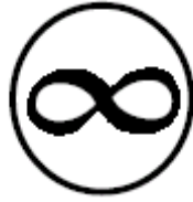
그림 2. 보존 용지 심볼 마크 .

문제가 되지 않는다. 대체적으로 정기간행물의 경우 저작권 부분에 주로 사용한다. 다만 승인되지 않은 종이에 상징이나 문구가 들어가지 않도록 주의해야 한다.