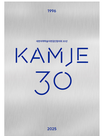
▲의편협 30년사 표지디자인

국가기관도 아니고 상업단체도 아닌 비영리 학술단체의 편집인들이 자발적으로 협의체를 구성하고 활동한다는 것은 세계 그 어느 곳을 뒤져봐도 찾기 어려운 매우 드문 경우입니다. 이 협의체의 가장 중심에 서는 단어는 감히 [헌신]이라고 말하고 싶습니다. 우리나라 의학수준을 널리 알리고, 의학학술지의 수준을 향상시키는 것을 목표로 학술지 평가와 교육, KoreaMed, KoreaMed Synapse, KoMCI 등의 데이터베이스의 구축과 운영, 출판윤리의 정리와 보급 등 모든 활동이 회원들의 자발적인 헌신에 의해 지난 30년간 꾸준히 지속되었다는 것은 정말 놀라운 일입니다. 그들의 헌신이야말로 한국 의학학술지 출판 발전의 토대가 아닐까 합니다. 학술지 출판의 환경은 빠르게 변하고 있습니다. 인공지능이 논문을 쓰고, 데이터가 상품이 되는 시대입니다. 그러나 기술이 아무리 진보해도, 학문을 지탱하는 것은 결국 사람이 아닐까 합니다. 30년이라는 세월은 한 세대를 어릴 때 쓰는 세월의 단위이기도 합니다. 의편협은 한 세대를 관통하는 우리나라 의학학술지 발전의 산 증인이며, 생생한 역사입니다. 누군가는 이런 종류의 기록지는 별로 쓸모가 없다고 할 지도 모르겠습니다. 그러나 이 기록들은 미래의 우리나라의 학술지를 짚어지고 갈 다음 세대 의학자들과 편집인들에게 전해주는 선배들의 발자취이며, 헌신의 기록으로 새로운 세대의 밑거름이 되리라 생각합니다.