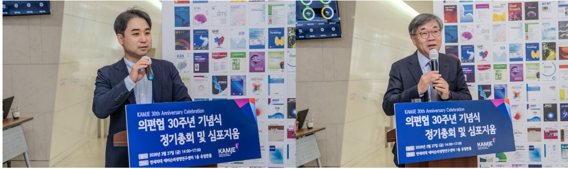
▲ 사회: 서동훈 기획운영위원장