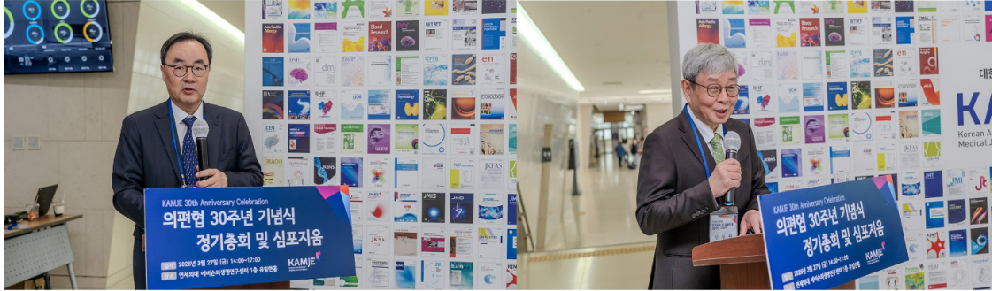
▲ 축사: 이진우 대한의학회장