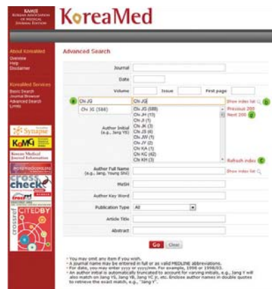
↑ 그림2. Author Initial search